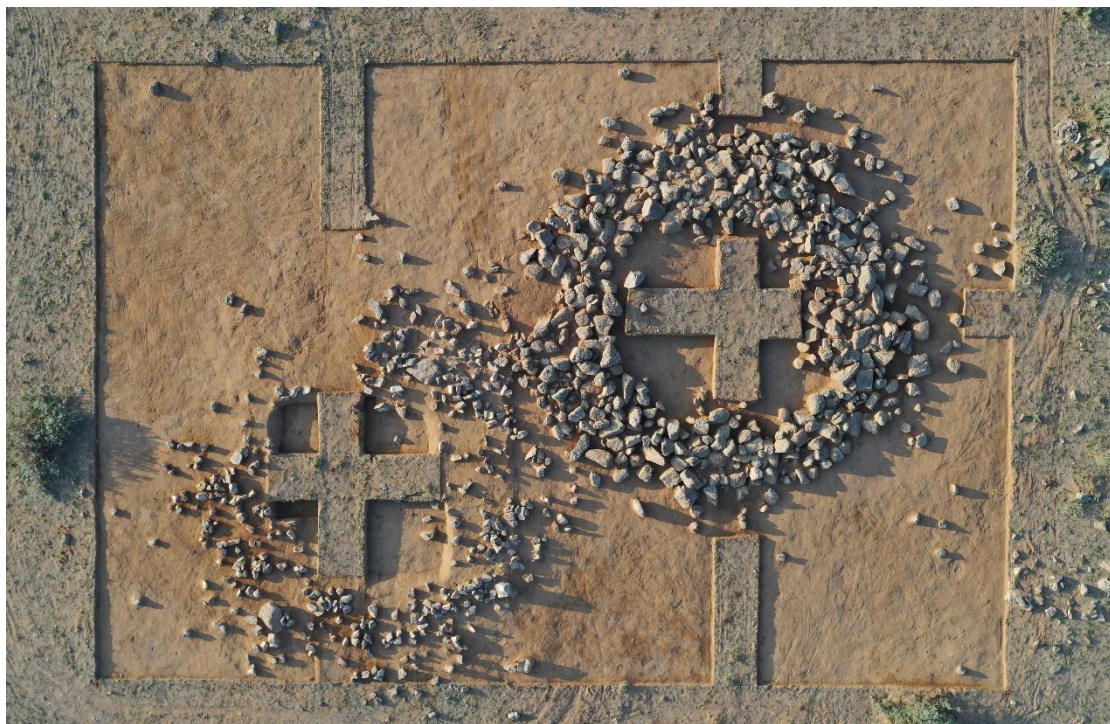
邵舒萌和庄艳丽负责发掘的 M13（左）和 M12（右）