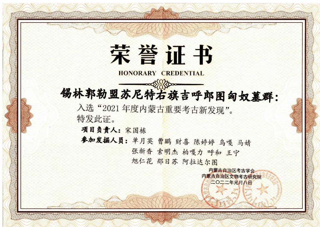
吉呼郎图匈奴墓群入选“2021年度内蒙古重要考古新发现”证书