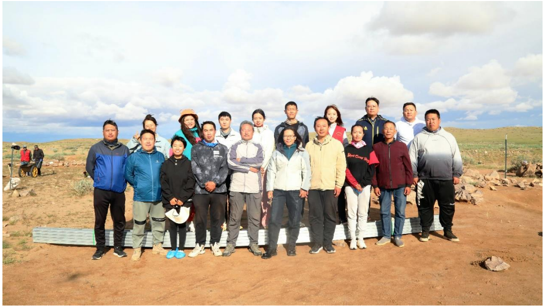
参加考古发掘队员集体合影