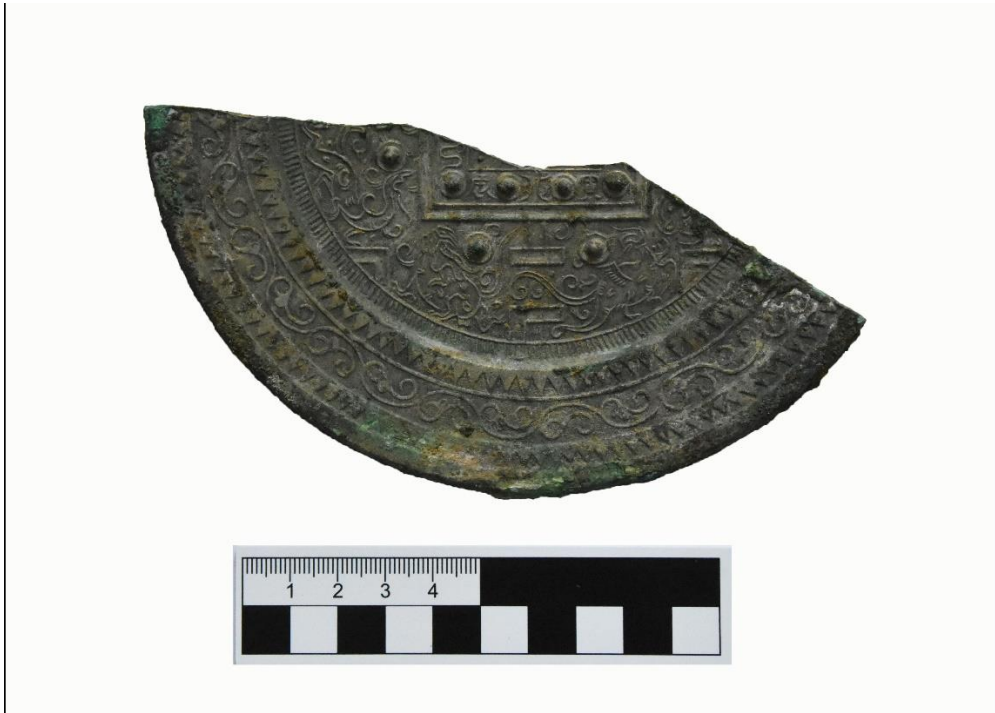
M10 出土的汉代青铜博局镜