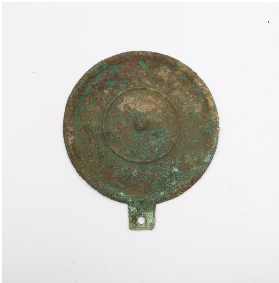
M11 出土的青铜带柄镜