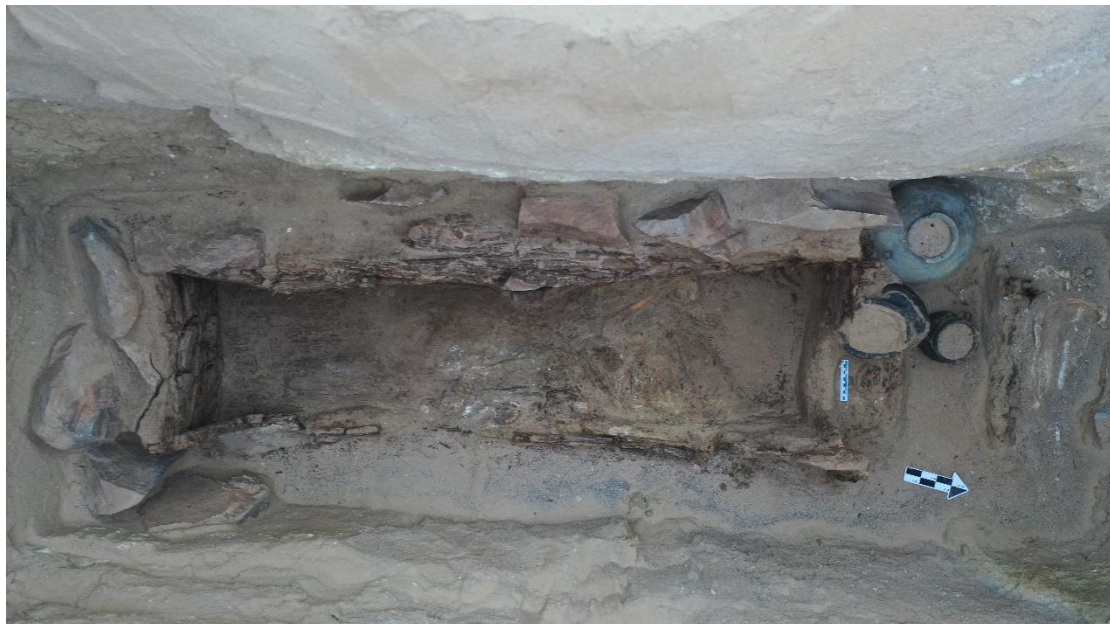
邵舒萌负责发掘的 M13 墓室情况